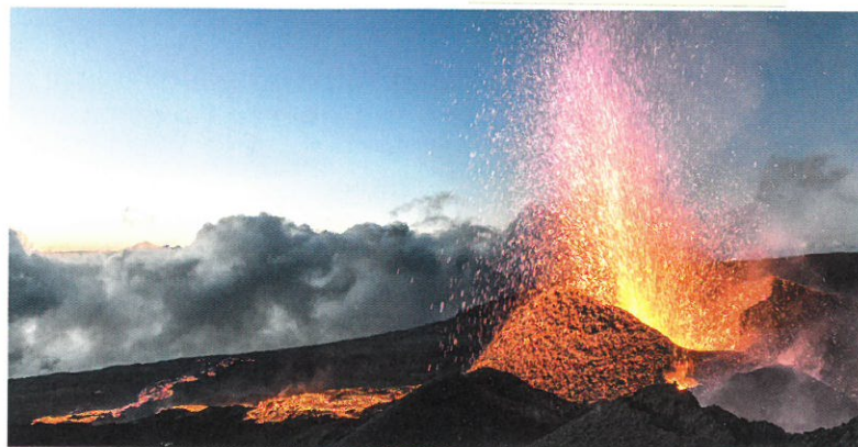
Der Vulkan Piton de la Fournaise ist noch immer aktiv.

ZUERST WIRD DER WILDE SÜDEN entdeckt. Dabei geht es der Küste entlang zum «Jardin des Epices». Dort können die Teilnehmenden die vielfältige Flora der Insel bestaunen, bevor sie an der Südküste die charmantesten Orte und paradisische Strände entdecken. Während der Reise gibt es auch Tage, die man selber gestalten kann. Sei dies mit einer Entdeckungstour auf eigene Faust oder Entspannung am Strand.